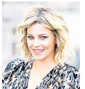
LIEBT NICHT NUR DIE ELBPHILHARMONIE: Elizabeth Banks ist Hamburg-Fan.

Die 45-Jährige und ihre Crew fühlten sich in der Stadt an der Elbe gut aufgehoben. „Wir sind wegen des Gebäudes gekommen“, sagte sie, „und dann geblieben, weil es noch unglaublich viele andere spannende Dinge gibt, die man in Hamburg drehen kann.“