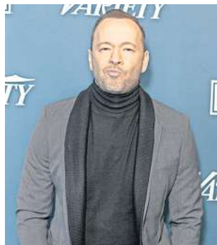
SUPER TYP: Donnie Wahlberg lässt andere an seinem Erfolg teilhaben.

Das Essen kostete 78,45 Dollar, und weil es der Neujahrstag war, legte Donnie Wahlberg (50) auf die Rechnung noch satte 2020 Dollar Trinkgeld (um die 1814 Euro) obendrauf. Wie das „People“-Magazin berichtet, war der „New Kids on the Block“-Star von einst mit seiner Frau Jenny McCarthy (47) in St. Charles (US-Bundesstaat Illinois) in einer Filiale der US-Restaurantkette IHOP essen.