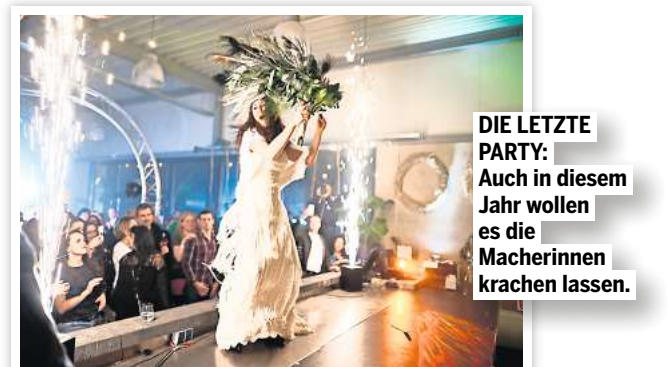
DIE LETZTE PARTY: Auch in diesem Jahr wollen es die Macherinnen krachen lassen.

nannt: „Es kommen ja nicht nur Bräute. Männer sind in den vergangenen zwei Jahren deutlich interessierter und auch eitler geworden, was ihre Hochzeit betrifft“, weiß Saage.